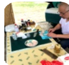
イカ刺ができました