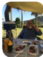
カツオの刺身で一杯

物産館で見つけた焼酎「日向木挽ブルー」は、今年の10月から全国で発売になりましたが、それまでは宮崎県にしかないので、カラになると、わざわざ送ってもらうほど美味しかったです。シーワサーを搾り入れて飲むとすっきりとして飲みやすいので、女性におすすめです。すぐそばに波の音、海から登る朝日に感動！しました。最低気温12度、最高気温25度と過ごしやすいキャンプでした。