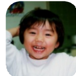
幼稚園での不安な様子と 自宅での元気いっぱい様子