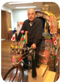
博多リバレインにて